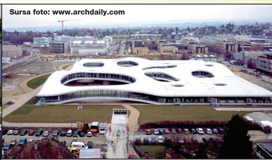
Complexul Muzeal de Științe ale Naturii - Delfinariul Rolex Center

Un cititor ne-a atras atenția că în lume există o clădire care se aseamănă, în opinia sa, cu proiectul de reamenajare a Delfinariului ce a câștigat marele premiu oferit de CJC. Proiectul Delfinariului ar avea elemente de arhitectură comune cu un centru universitar din Lausanne, Elveția. Informația ne-a fost transmisă de un cititor, prin intermediul unui comentariu postat pe site-ul ZIUA de Constanța, la materialul „Așa va arăta noul Delfinariu“, publicat în ediția din 6