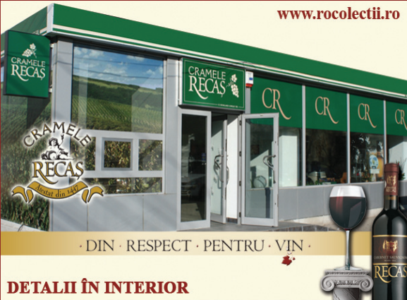
DETALII ÎN INTERIOR