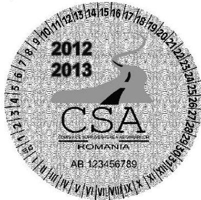
Fața sticker CSA