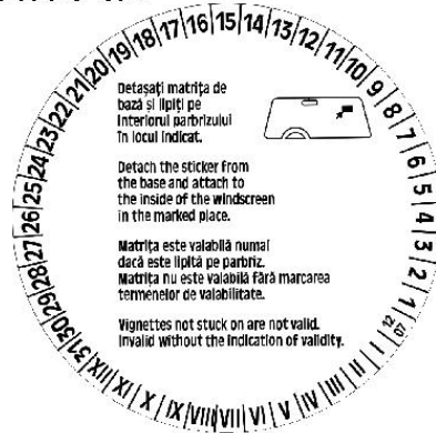
Verso sticker CSA