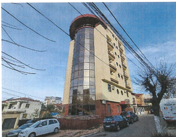
Vedere generala imobil