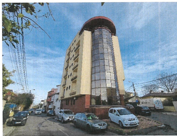
Vedere generala cai acces si vecinatati