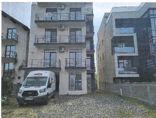
Vedere generala ( din Bd Mamaia Nord )