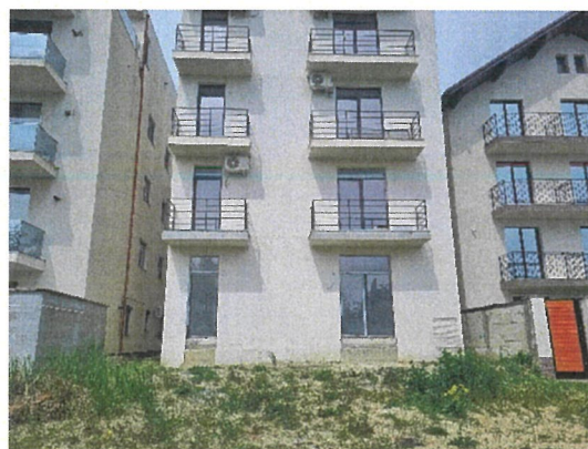
Vedere generala ( din spate )