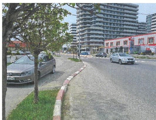
Vedere cale de acces si vecinatati