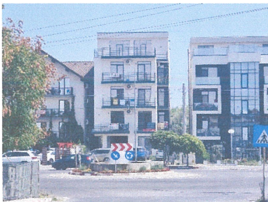
Vedere generala ( din Bd Mamaia Nord )