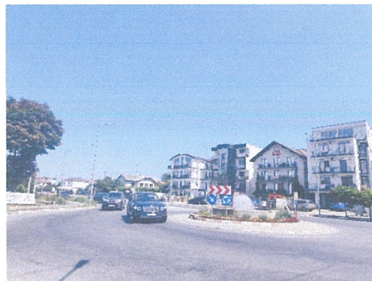
Vedere cale de acces si vecinatati