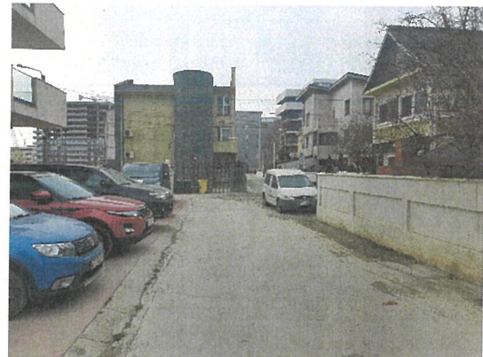
Vedere cale acces si vecinatati