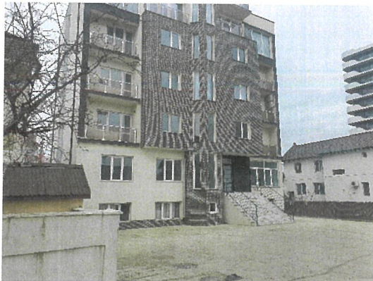
Vedere din strada principala