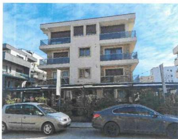
Vedere generala imobil apartinator