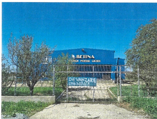
Vedere generala imobil