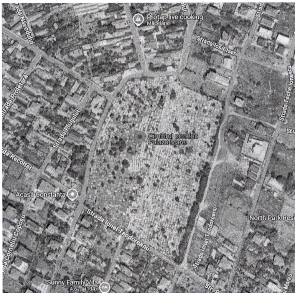
Harta Google maps