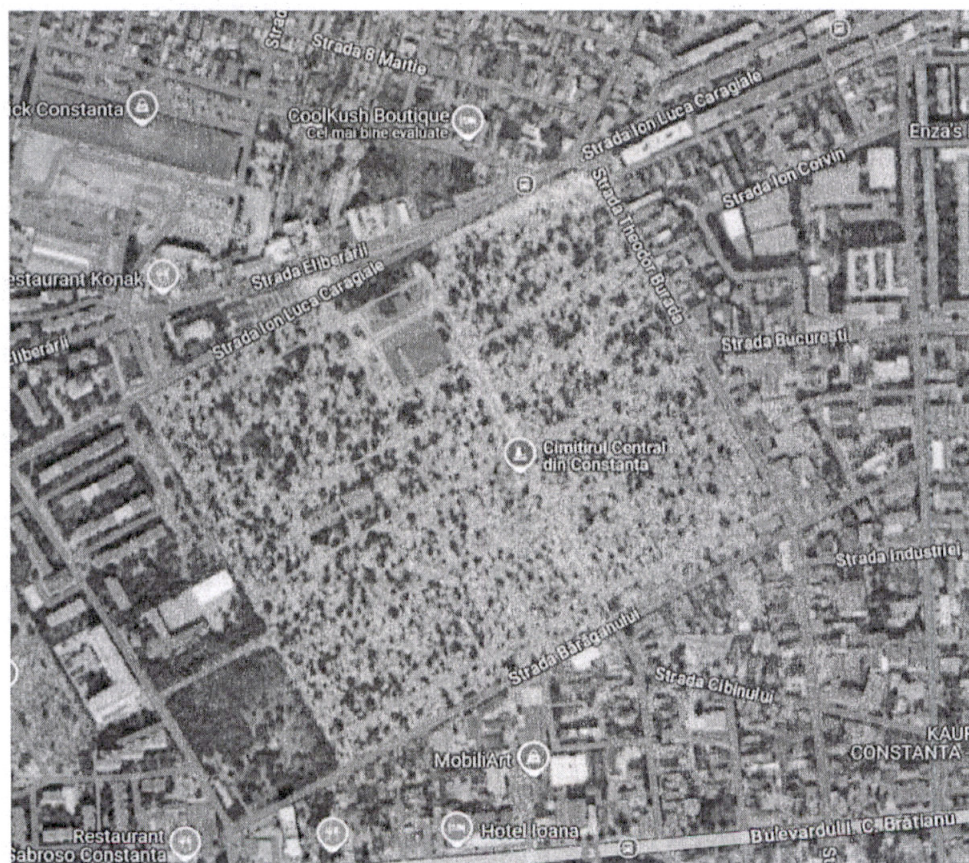
Harta Google maps