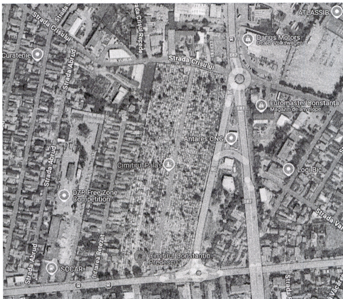
Harta Google maps