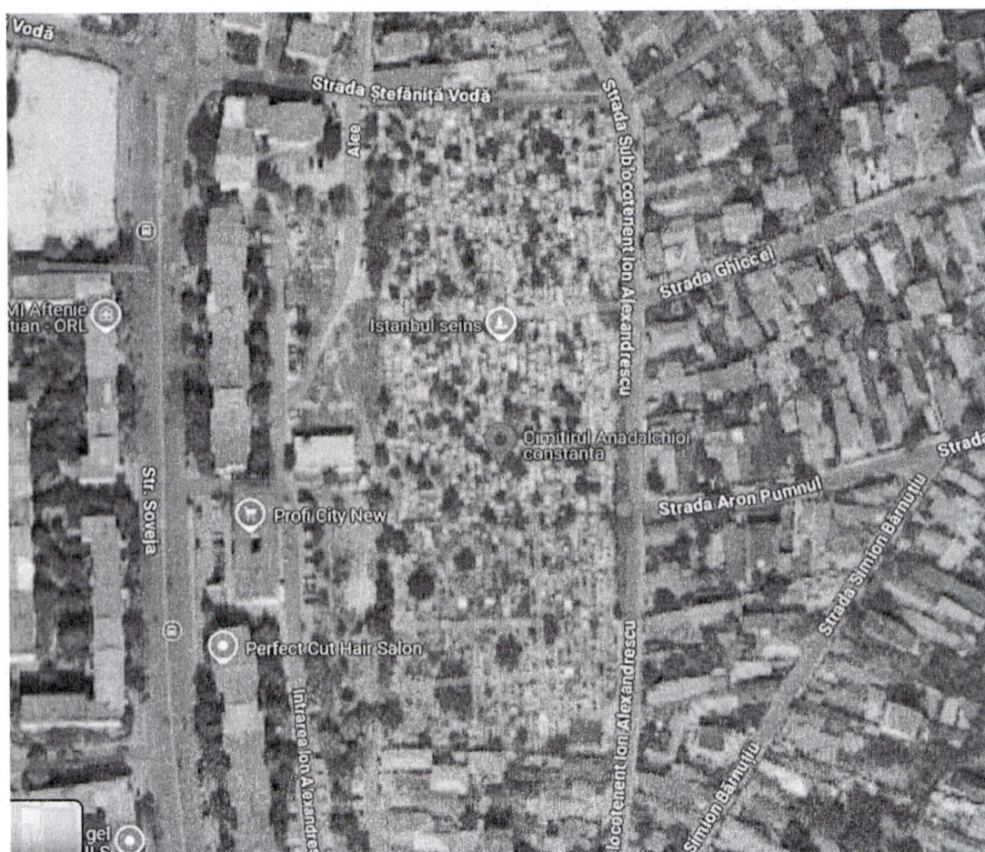
Harta Google maps