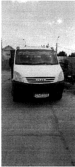
IVECO DAILY 65C15 (CT-12-SDX) 2008