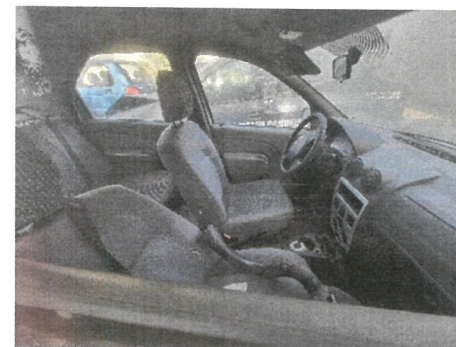
Autoturism Dacia Logan , CT-54-SPP