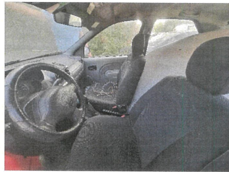
Autoturism Dacia Logan , CT-49-SPP