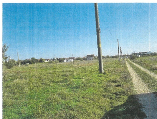
Vedere acces si vecinatati