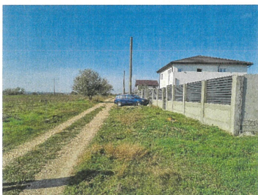
Vedere acces si vecinatati