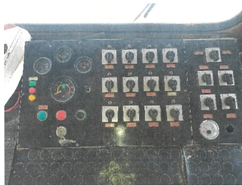
Vedere panou comanda