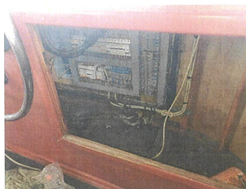
Vedere sub panou comanda