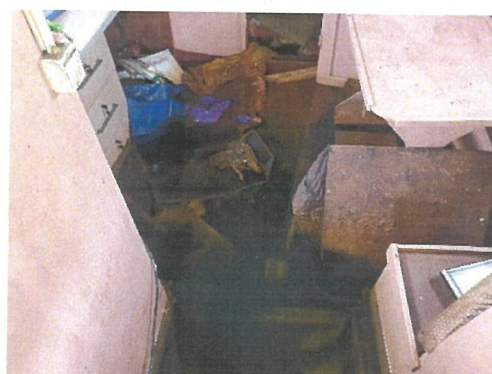
Vedere cabina echipaj