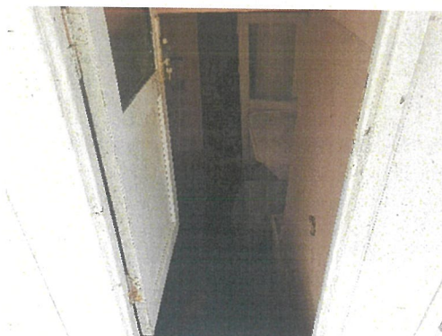
Vedere cabina echipaj