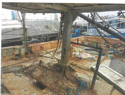
Vedere punte pupa