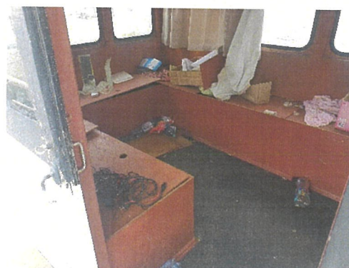
Vedere cabina comanda