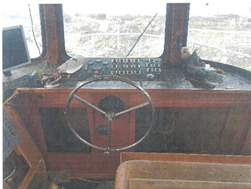
Vedere cabina comanda