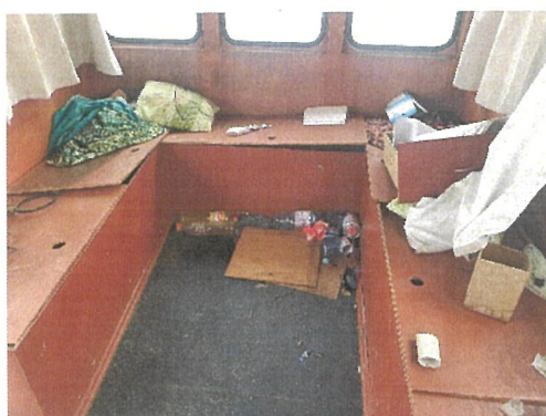
Vedere cabina comanda